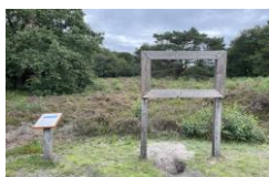
Fotoraam Mensinge bos